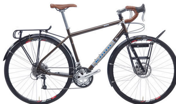
Due tipiche Touring bikes con manubrio da corsa, portapacchi anteriori e posteriori e ruote da 28''